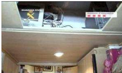
Imagen tomada de un vídeo facilitado por los Mossos d'Esquadra del material incautado en la operación contra la red de pornografía infantil "Protegenos.com" en la que doce personas han sido detenidas. El golpe contra la Red se precipitó la semana pasada al descubrirse que los detenidos, entre los que de forma inusual figura una mujer, se habían ganado la confianza de quince menores, que estaban en situación de riesgo o ya habían sido víctimas de abusos.

El golpe contra la red de pornografía infantil "Protegenos.com" se precipitó la semana pasada al descubrirse que los detenidos, entre los que de forma inusual figura una mujer, se habían ganado la confianza de quince menores, que estaban en situación de riesgo o ya habían sido víctimas de abusos.